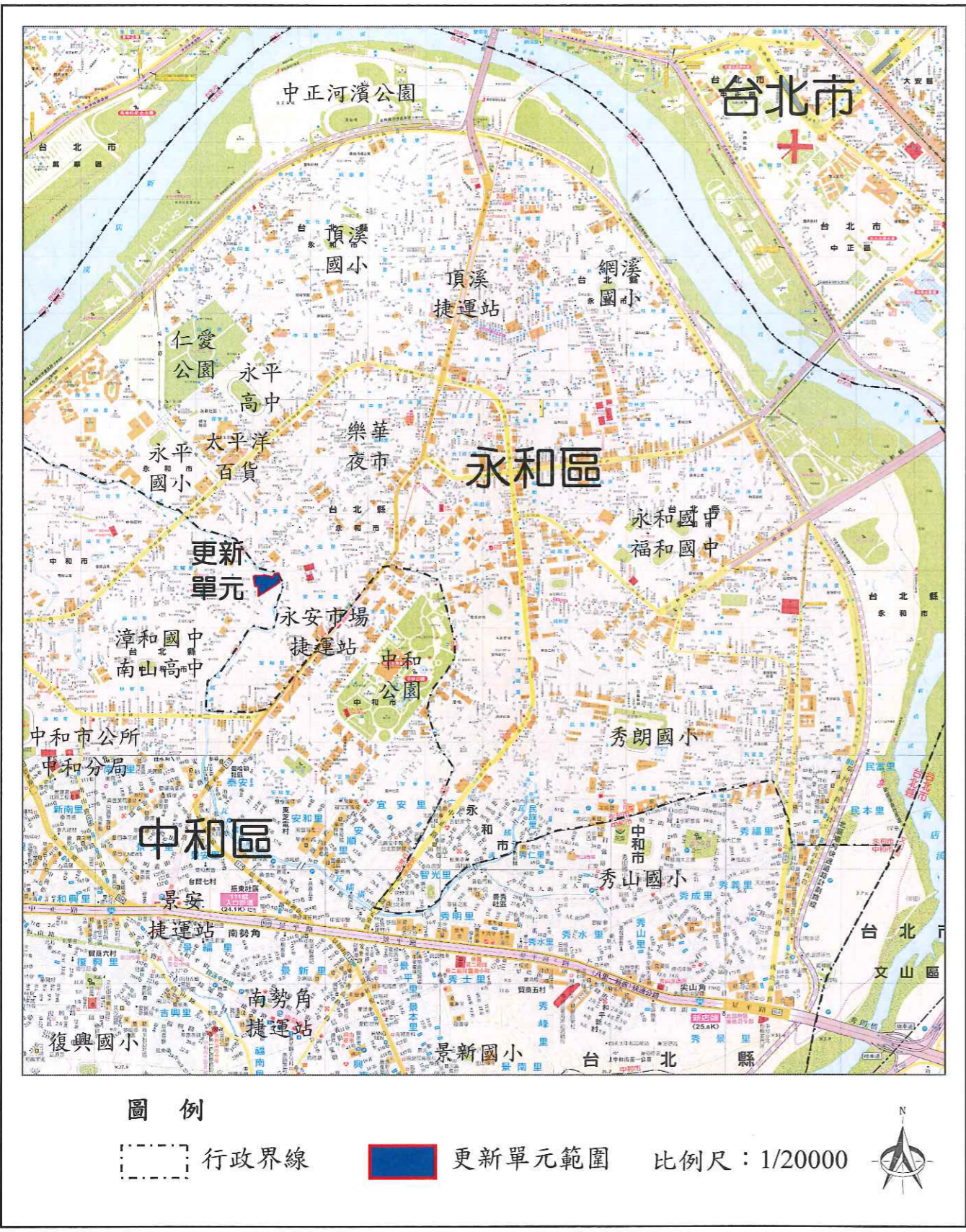
圖 2-1 更新單元地理位置圖