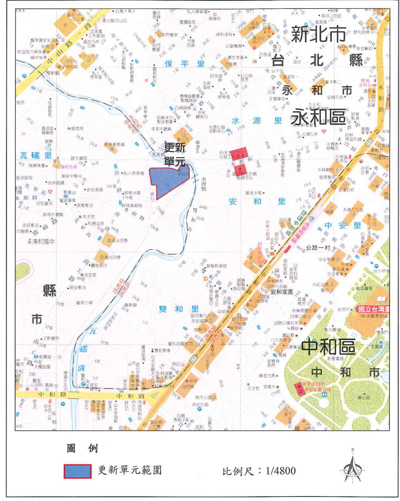
圖 2-2 更新單元地理位置圖 (2)