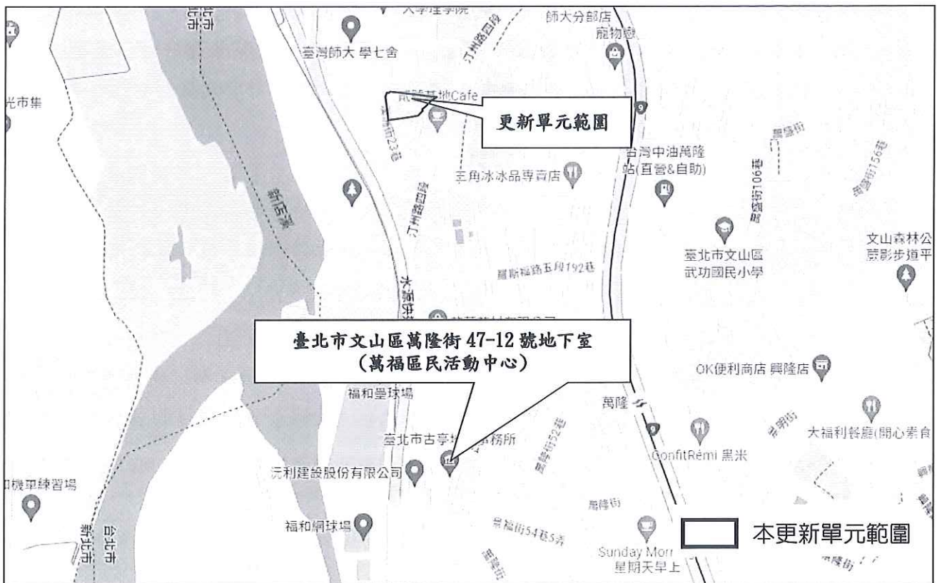
圖 2 開會地點示意圖